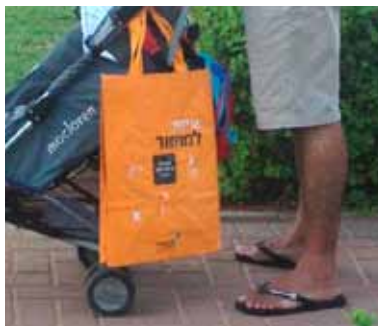
חלוקת שקיות לאיסוף אריזות למחזור במועצה אזורית יואב

במהלך החציון הראשון של 2013 פיתחה תמיר ערכות הסברה לגני ילדים המסבירות את תהליכי הפרדת הפסולת לדור הצעיר. בנוסף פותחו מערכי שיעור לגילאי בית הספר היסודי, המעניקים לדור העתיד את הבסיס הנדרש להפרדת פסולת מיטבית.