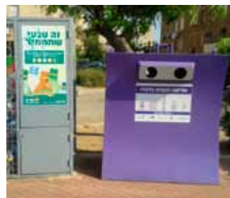
פח סגול לאיסוף אריזות זכוכית באשדוד

להתקשרויות אלו חשיבות מרובה, שכן באופן זה נוצרת תשתית יציבה לאיסוף פסולת האריזות המופרדת והבאתה למחזור. בכך תתאפשר בטווח הארוך, עמידה ביעדי המחזור הקבועים בחוק.