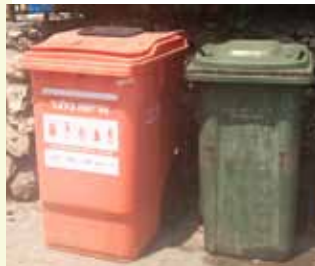
פח כתום לאיסוף אריזות בהרצליה

נכון להיום התקשרה תמיר עם 84 רשויות מקומיות ומועצות איזוריות בכל רחבי הארץ, בהן מתגוררים למעלה מ-3 מיליון תושבים