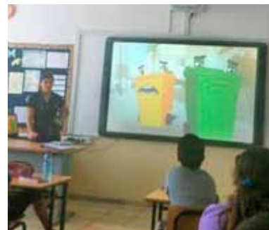
שיעור על הפרדת פסולת אריזות בעיר נשר

תמיר מבצעת פעילויות הסברה וחינוך בקרב התושבים בכדי לעודד שינוי בהרגלי השלכת פסולת האריזות על ידם והטמעת עקרונות של הפרדת הפסולת ומחזור.